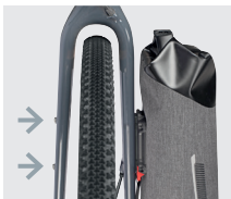
On Forks · 3 kg max.