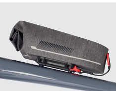
On Frame · 3 kg max.

Extraflacher Adapter zur Verschraubung an Rahmengewinden. Mit Duo Kupplung ausgestattete Taschen für Rahmen und Gabel sitzen so besonders nah und unauffällig am Rad. Nutzbar für Bikes mit mindestens 2 Gewindebuchsen an Rahmen oder Gabel.